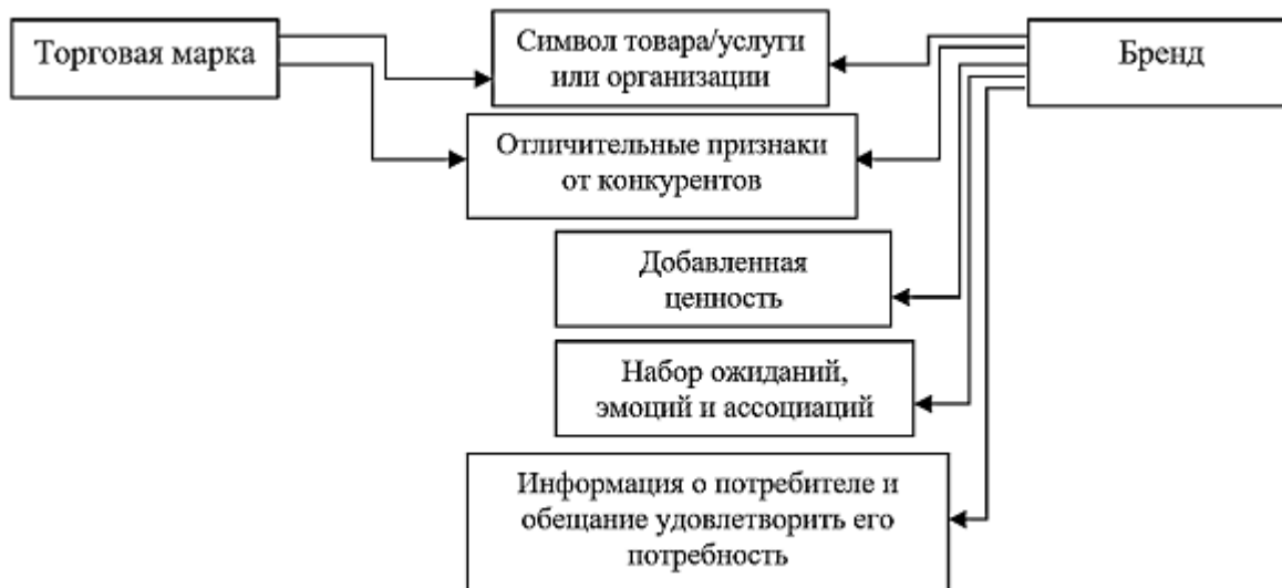
Рис. 1. Сравнение элементов понятия «бренд» и «торговая марка»

психологическое эмоциональное удовлетворение от пользования этим брендом. Следовательно, можно утверждать, что любой бренд является торговой маркой, но не каждая торговая марка является брендом (рис. 1).